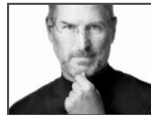
Quand Steve Jobs buvait des jus contre son cancer