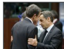
Les trois non-dits de l'accord de Bruxelles