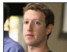
L'Europe, rempart contre le fichage façon Facebook