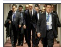
Grèce : l'Europe pousse Papandréou à renoncer