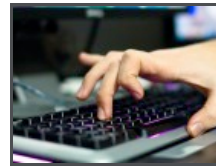
Le Bon Coin : j'ai testé l'arnaque à la tondeuse

« Dans le contexte professionnel, environ 10% des salariés consommeraient régulièrement ou occasionnellement des produits illicites ; en premier lieu et très majoritairement, le cannabis (de l'ordre de 8%), puis la cocaïne, les amphétamines et – très peu – l'héroïne. »